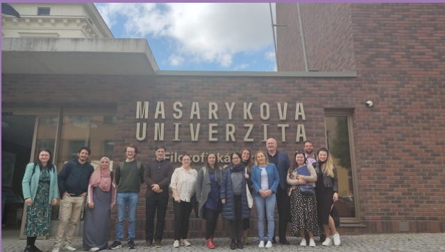
სურათზე: პროექტის მონაწილეები მასარიკის უნივერსიტეტში

მშვენიერმა მასარიკის უნივერსიტეტმა ბრნოში, ჩეხეთის რესპუბლიკაში, უმასპინძლა პროექტის პირველ სასწავლო ვიზიტს. პროექტის მონაწილეები ჩამოვიდნენ შორიდან, რათა შეესწავლათ ჩეხეთის განათლების სისტემაში კოლეგიური მხარდაჭერის უნიკალური მიდგომები.