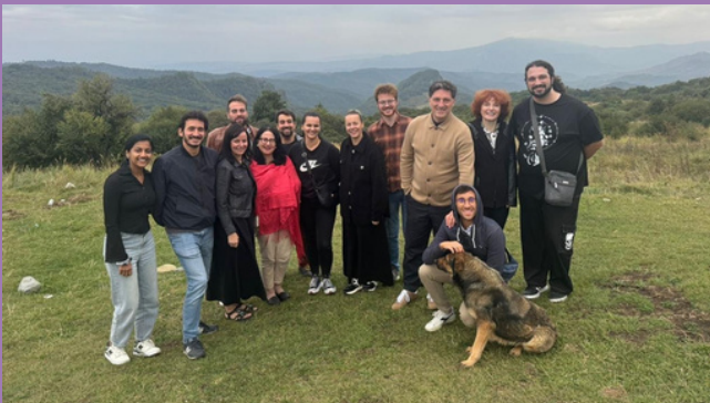
In foto: I nostri partecipanti nelle montagne della Georgia.

La nostra meravigliosa organizzazione partner TPDC di Tbilisi, Georgia, ha ospitato la quarta visita di studio del progetto. I partecipanti sono arrivati da tutta Europa per apprendere dalle esperienze dei principali stakeholder nel sistema educativo georgiano.